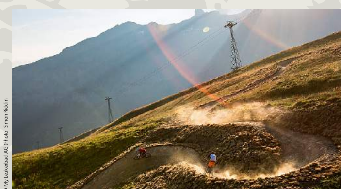
Flowtrail Leukerbad – Spass für die ganze Familie Flowtrail Leukerbad – du plaisir pour toute la famille