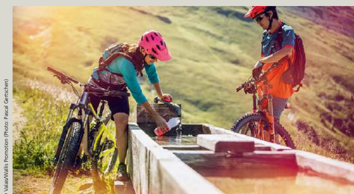
Nicht Thermalwasser, aber genau so erfrischend Pas de l'eau thermale, mais tout aussi rafraîchissante