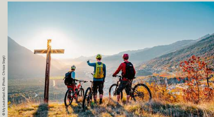
Bike Region Pfyng-Finges – immer ein Erlebnis Bike Region Pfyng-Finges – toujours une expérience