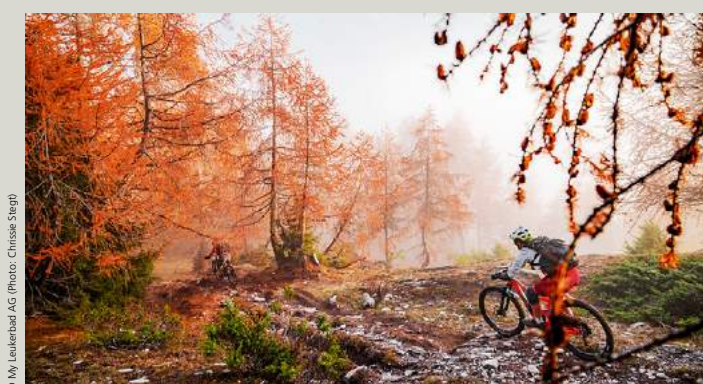
Herbststimmung im Varneralp auf der Route 4, «Chällerflüe Bike» Ambiance automnale dans le Varneralp sur l'itinéraire 4, «Chällerflüe Bike»