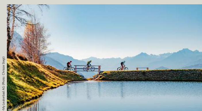
Entlang des Speicherssees bei Guttet auf den Routen 1, 2, 7 oder 16 Le long du réservoir près de Guttet sur les itinéraires 1, 2, 7 ou 16