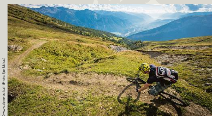
Torrenttrail: Das Trail-Highlight mit knapp 30 km Länge Torrenttrail: Le «singletail highlight» de la région avec une longueur de presque 30 km