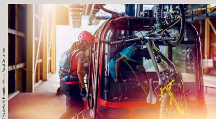
Biketransport: Bergbahnen Torrent, Gemmi, Gampel-Jeizinen oder Bus Leuk–Leukerbad (LLB) Transport de VTT: Remontées mécaniques Torrent, Gemmi, Gampel-Jeizinen ou bus Leuk–Leukerbad (LLB)